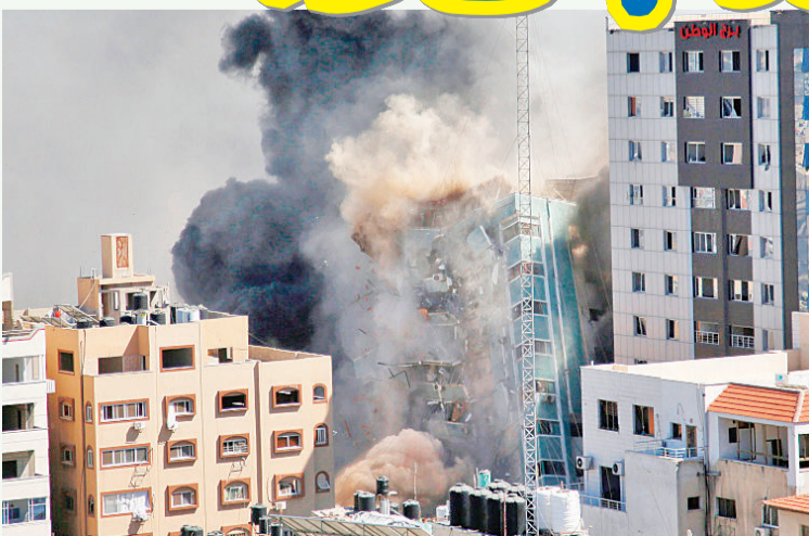
以色列空袭加沙,美联社、半岛电视台大楼被摧毁。

以巴冲突持续升温,至少148人在加沙被杀,包括41名儿童,在双方互相指责之际,基督教不同阵营人士政见立场也出现分歧,基督教援助组织指责以色列发动攻击;美国西班牙裔基督教领袖反指哈马斯进行恐怖袭击。