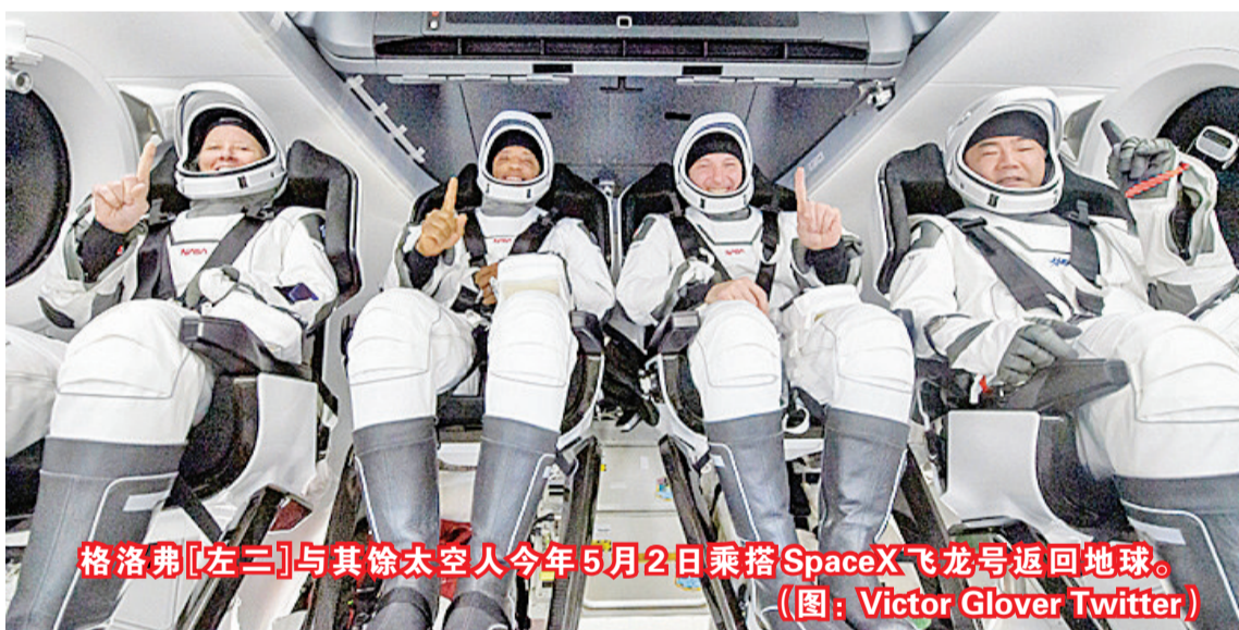
格洛弗[左三]与其余太空人今年5月2日乘搭SpaceX飞龙号返回地球。

国际太空站首位黑人太空人在社交平台贴出两幅相片,从太空观看地球日出美景,并感悟诗篇30篇的真理。